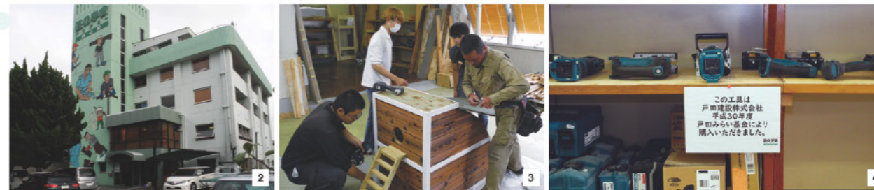
2: 琴平町の元病院を改修した校舎。壁面の絵画は地元の小学生によるもの。3: 取材時は3年生が卒業制作の作業中であった。4: 作業に必要な各種道具類も完備している。