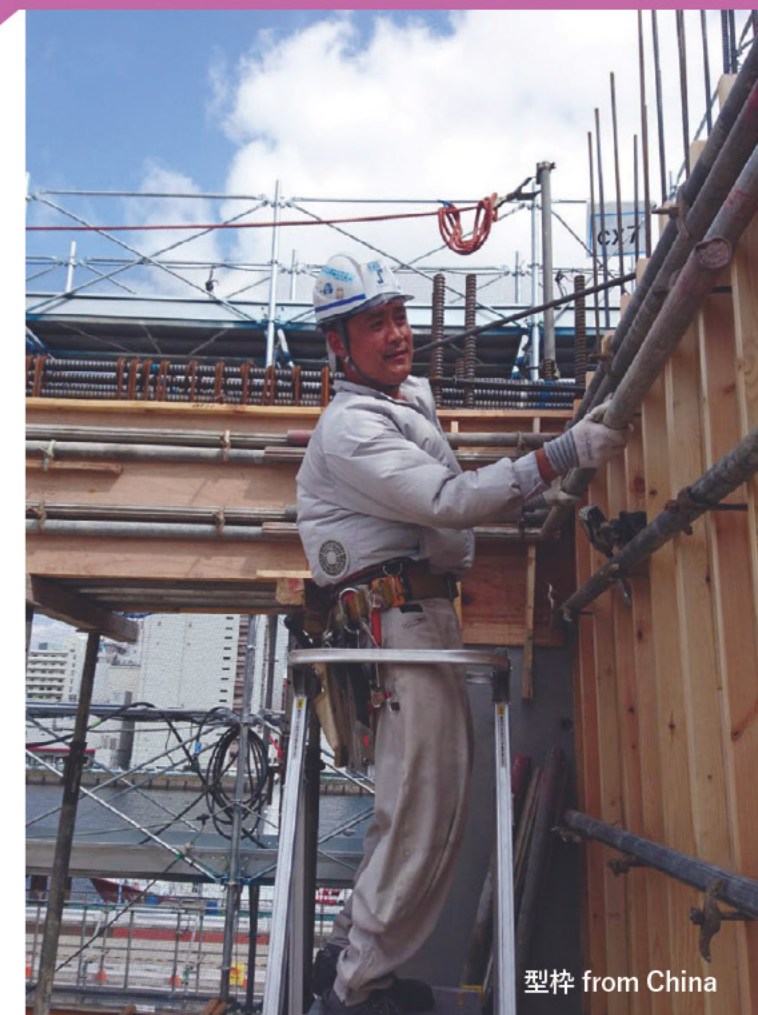
型枠 from China

日本の建設業界では、若者の入職者が減少し続け、特に近年では熟練者の引退により担い手不足が大きな課題となっている。千葉県にある型枠会社の社長は「他にも様々な選択肢がある中で、日本の若者はなかなかこの世界に入りません。しかし新興国に目を向けると日本の現場で働きたいという優秀な人材がたくさんいます。当社では18年前から中国人に来てもらっていますが、皆とても勤勉で誠実です」と話す。20数名の中国人が在籍するこの会社では、本国の家族と安心してコミュニケーションできるようインターネット完備の宿舎を用意するなど、受け入れ体制に力を入れている。「今後、日本の生産人口がますます減っていく中で私たちもある程度の部分は外国人の人の力が必要になります。そういう中で彼らがファミリーとして働けるような体制と魅力づくりが私たち企業に求められていると思います」。この会社のような先進的な取り組みが全国に広がるように、戸田みらい基金では外国人の受け入れに係る諸費用の一部を補助している。