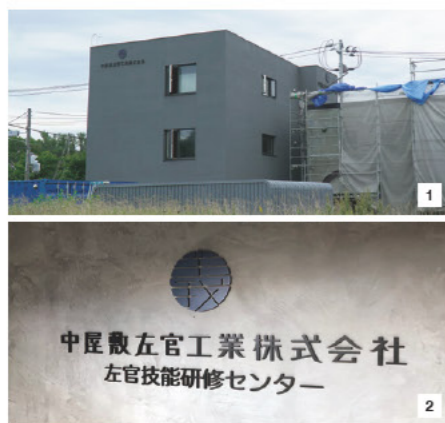
1 2: 左官技能研修センター。2011年に即戦力育成プログラムをはじめた場所に、2017年に新築された。

中屋敷社長が若手技能者の育成という大きな課題に取り組みはじめたのは今から8年前のこと。2011年のある日、ふと自社の職人の年齢に10年を足した一覧表をつくってみたところ、愕然としたと言う。「当時職人は34名おり、その平均年齢は51.5歳でしたが、もし新人が育たず10年経てば、2021年の平均年齢は61.5歳になります。これを見たとき私は会社の未来に強い危機感をもち、採用と育成の大改革に着手しました」。