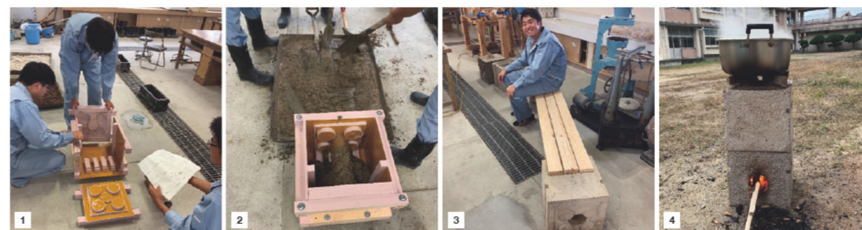
■1：設計を行い、その図面を確認しながら製作した型枠を組み立てる。■2：軽量コンクリートの最適な配合割合を算出し、それに基づいたコンクリートを練り、型枠へ打設。■3：完成したロケットストーブ。

具体的には同校の建築コースが耐火性能・断熱性能を向上させた軽量コンクリートを用いて、日常時はベンチとして使用し、緊急時にはロケットストーブとして活用できるベンチ型ロケットストーブを設計・製作した。また避難場所への設置も行った。避難場所への普及が進むように、一品物を生産するのではなく、量産化や製品化が考慮された。