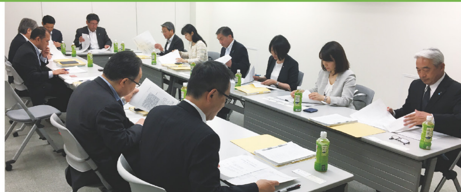
戸田みらい基金の審査委員会の様子。

戸田みらい基金は、安全で安心な建物や社会インフラ等の整備及び保全に対して、建設技能者をはじめとする「担い手の拡大」と、「技術・技能の向上」という観点から貢献していくことを目的に設立されました。現在、以下の4つの助成活動を展開しています。