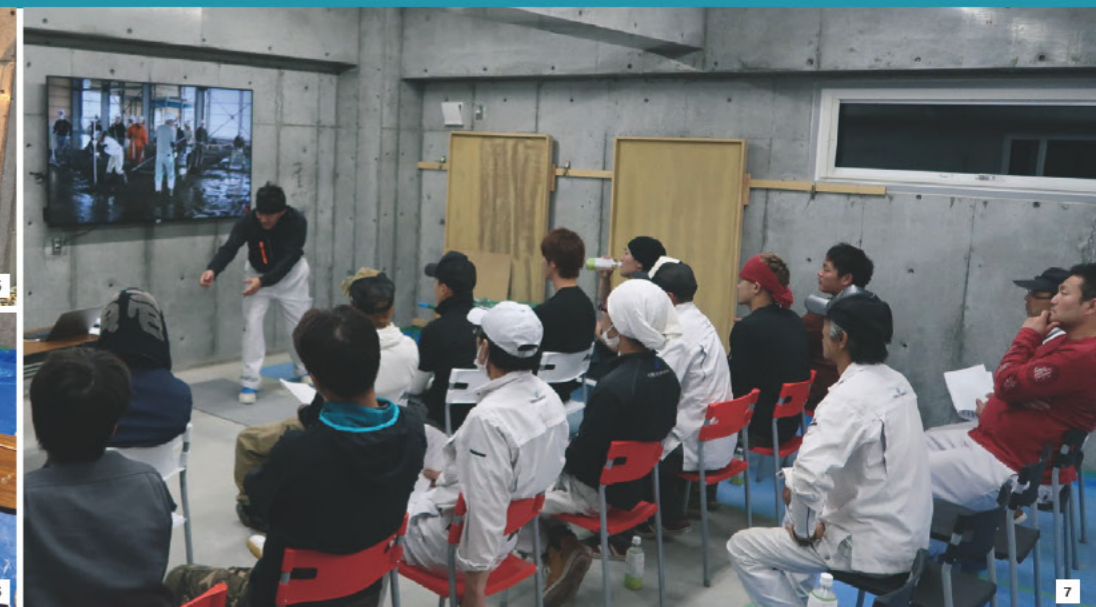
5: 左官技能検定を想定した実習台の前に、若手社員が練習を重ねる。6: 夜、仕事を終えた社員たちが車を走らせて研修センターに集まり、難易度の高い工事や新工法の習得に励む。新人教育だけでなく、若手からベテランまで幅広い世代が集うこうした研修でも、各分野で最高の職人を手本にした動画が最上のツールとなる。

それまでも新人採用は行っていたものの、右も左も分からない人が現場でできる仕事は掃除・片付け程度しかなく、入社しても直ぐに辞めるといった悪循環であった。「これでは駄目だと思ってつくったのが“即戦力育成プログラム”です。まず職長に現場で何が出来る人材が欲しいのかを聞き、それを新人が1カ月間で習得できるプログラムを考案しました。新人はこの間現場に出さず、現場において最低限必要な安全・材料・技術の知識、Pコン埋めに代表される現場ですぐに役立つ技術、そして塗り壁トレーニングによる養生を身に付けます」。このプログラムでは、作業を闇雲に身体で覚えさせるのではなく、先に理論を教え、その後練習することを繰り返す。これが今の若者にとって最も習熟度が高いと言う。この取り組みの結果、新人の離職者は急激に減り、8年後の現在、技能者社員45名、平均年齢38歳となった。同社のこの新人教育プログラムは、2014年からは札幌左官高等職業訓練校にも採用され、以降中屋敷社長は新入社員を同校に通わせるかたちを採っている。「この認定職業訓練校のカリキュラムとして研修することで、順調にいけば入社2年目には二級技能検定、5年目には一級技能検定への道が開けます。若者の目標や自信となるこうしたキャリアパスを示すことも重要です」。