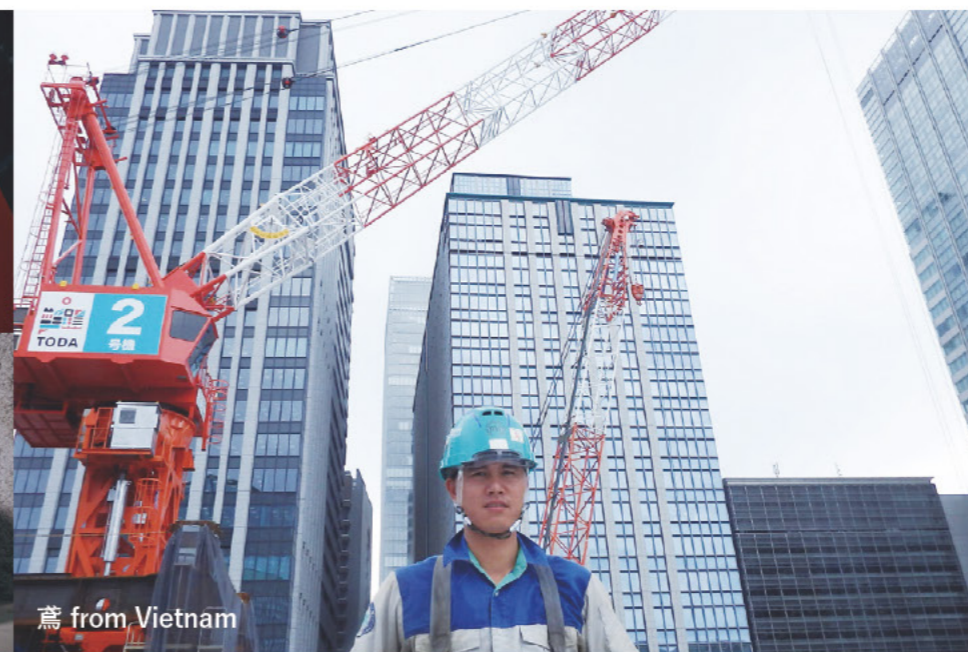
鳶 from Vietnam