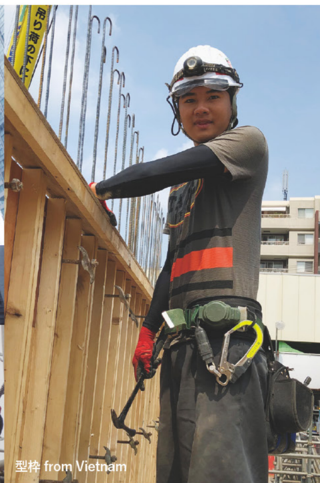
型枠 from Vietnam