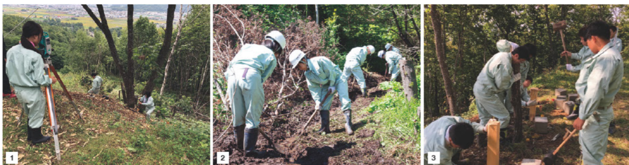
■1：公園を整備するために実施した山林部の測量。■2：小川の下部に池を造るために実施した付け替え工事。■3：山の中腹部は街を見下ろせる絶景ポイント。この場所を公園整備計画の目玉となる「夜景の見える展望スポット」とすべく整備が進められている。写真は学校で製作したコンクリートを用いた土台設置の様子。

総合的に関わることができる知識や技能を修得し、これを有機的・総合的に結合できる地域社会の担い手へと育成することを目指している。研究開発の成果は、地域の「町おこし」や「観光資源」として活用する。現在、学校と地域の企業が協力して、この緑化事業の実現を推進している。