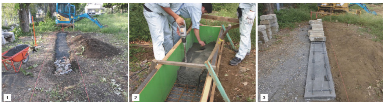
■1：夏休み中に材料を揃え、9月から作業を本格的に開始した。まず実習地の石垣を築く部分のレベルを確認し、根切り、地盤強化（ガラや砕石の敷き詰め）、転圧などを行った。■2：次に型枠を組み、仕上がり高に墨を出し、コンクリートを打設。■3：異形鉄筋をベース上部に敷いて結束し、石垣となるブロックを積んでいく。

使用して石垣を築き、実習場所と外部を分断した。石垣の内側から外側へ土を送って地盤の高低差をつくることで、土埃の解消と音の伝達軽減を実現した。石垣の外側の庭園部分にはインターロッキングやレンガを敷均し、歩行地と実習地の区分けを行った。これは雑草除去の一助になり、また近隣環境の向上にもなった。