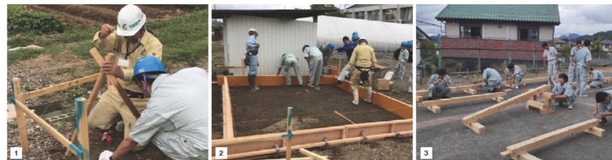
■1：四阿は同校の農場施設内に設置される。最初に建設業協会の指導を受けながら測量、掘削、丁張りが設置された。■2：基礎コンクリート施工のための型枠設置作業。■3：四阿の柱・梁の加工状況。柱・梁は接合のためのホゾ穴を開ける加工も行った。

この四阿は将来的に同校の農と食科（農業）で生産した農作物の販売場として利用するほか、課題研究発表会や学習成果発表会でも披露される。ものづくりは技術や知識だけではなく、使う人のことを考えることが重要である。生徒たちが自分で手掛けたものが継続的に使用されることにより、建設業のやりがいを感じる機会となることを意図した。