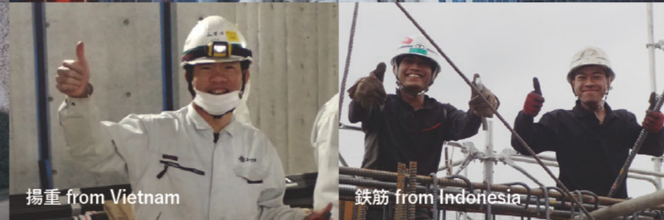
揚重 from Vietnam