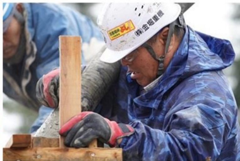
現場での真剣な姿