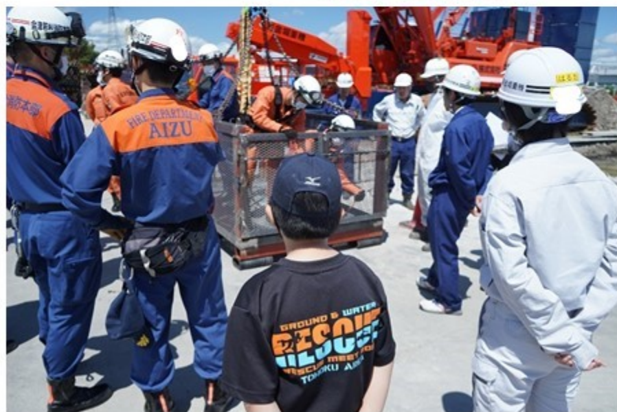
消防隊との合同訓練