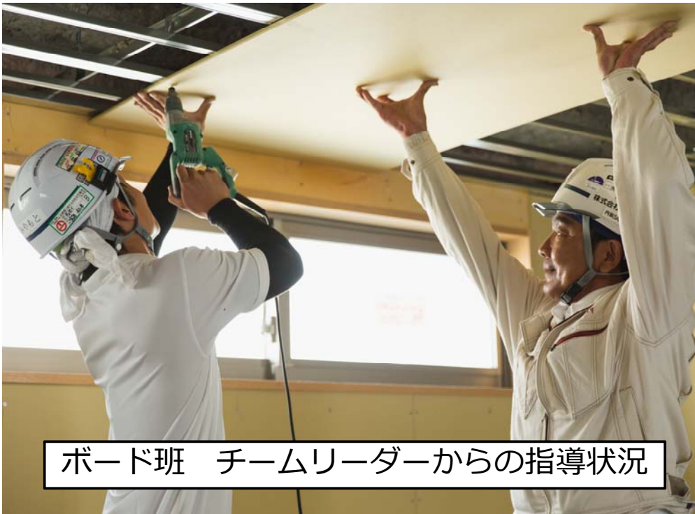
ボード班 チームリーダーからの指導状況