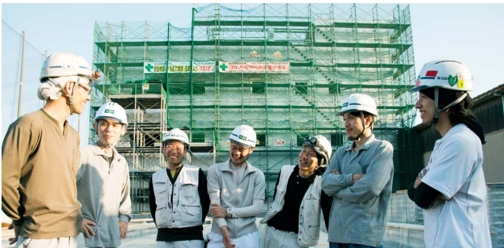
職友会の若い親方