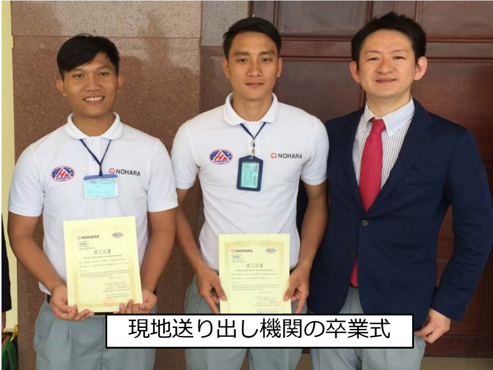
現地送り出し機関の卒業式