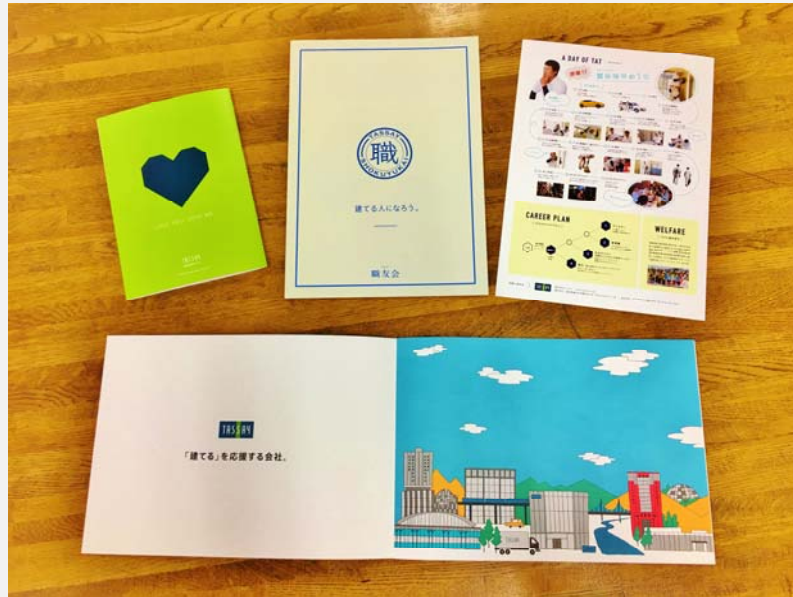
企業パンフ・採用案内