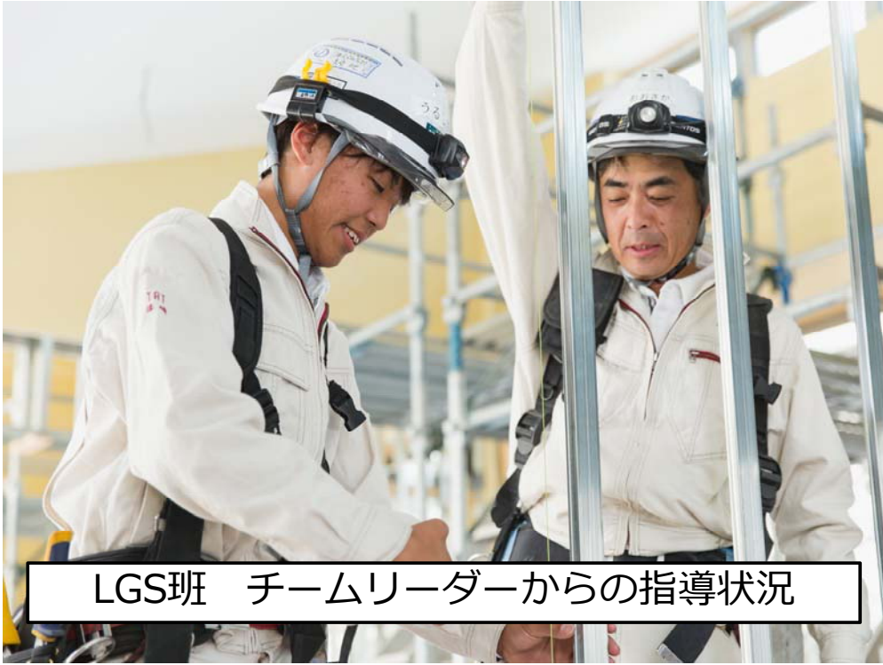
LGS班 チームリーダーからの指導状況