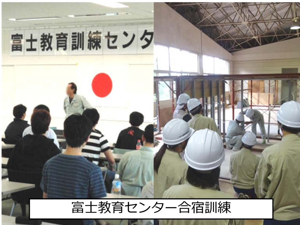
富士教育センター合宿訓練