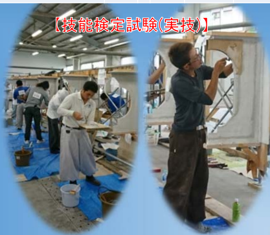
【技能検定試験(実技)】