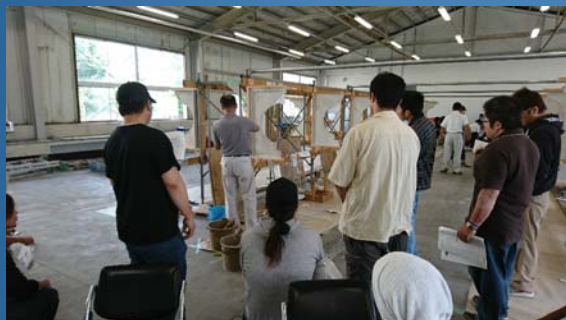
【技能検定試験向上訓練(1,2級)】

技能検定試験受験者に向けた事前講習会を実技・学科それぞれ実施し、より多くの有資格者を増やすよう貢献。