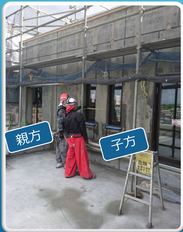
マンツーマンでのタイル割付け指導