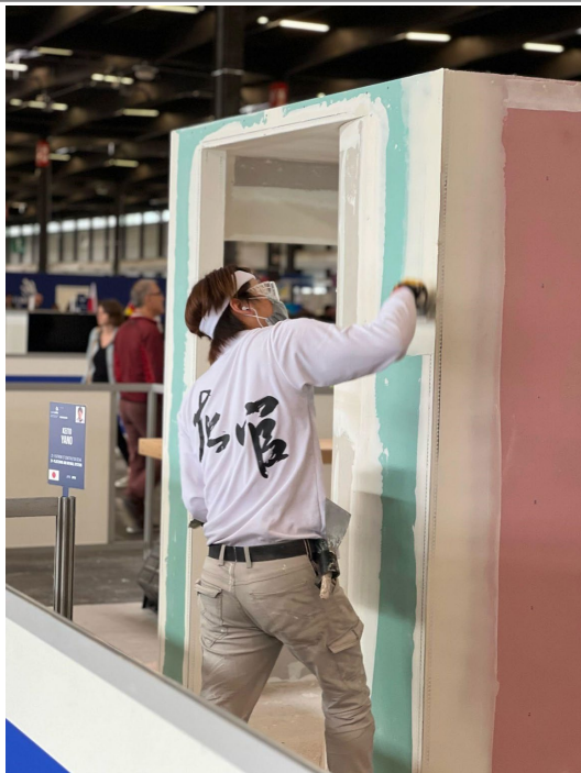
↑ 技能五輪国際大会