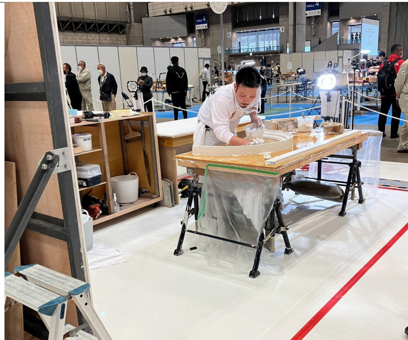
技能五輪全国大会 ↑