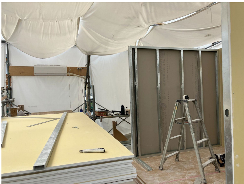
↑ 八潮市の訓練場内部のようす