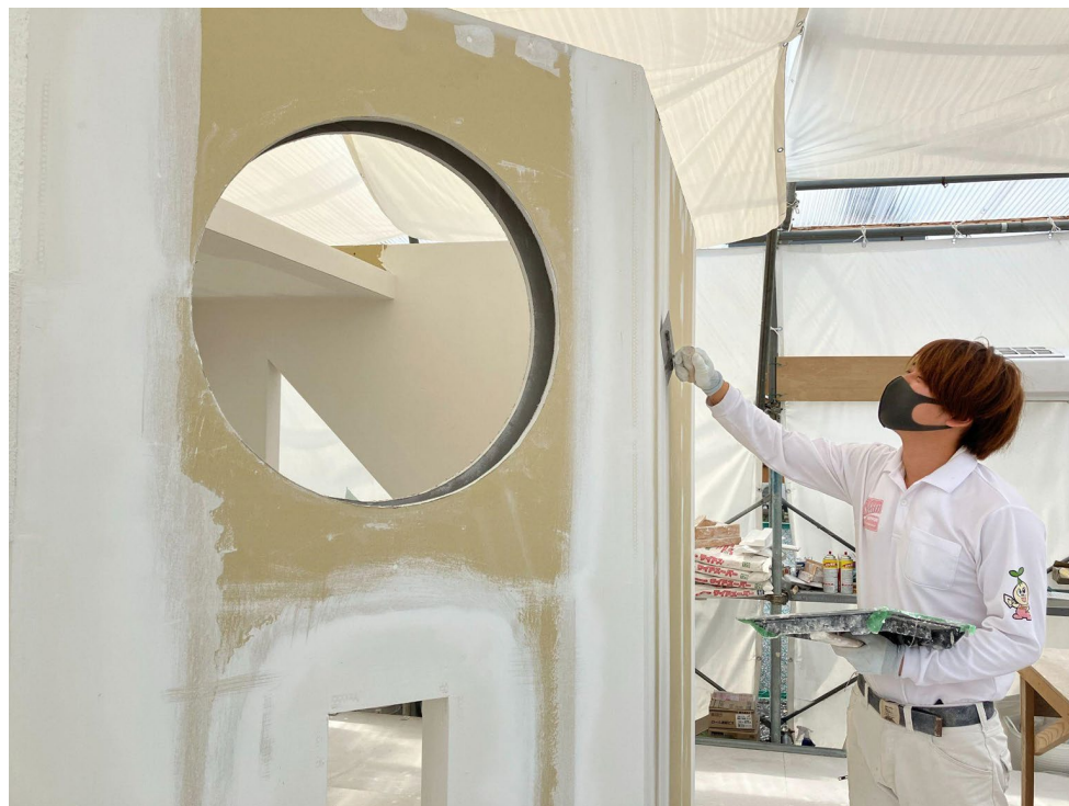
↑ 作成中の過去大会の課題