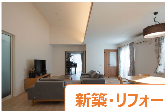
新築・リフォーム工事業