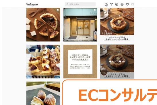
ECコンサルティング業