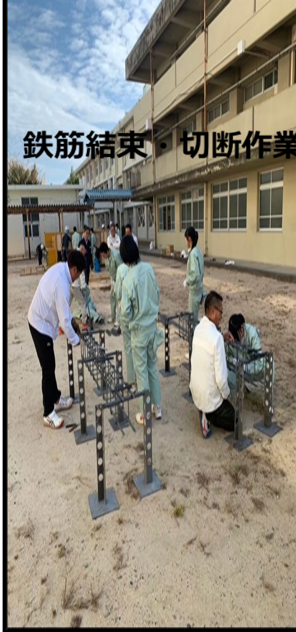
鉄筋結束・切断作業