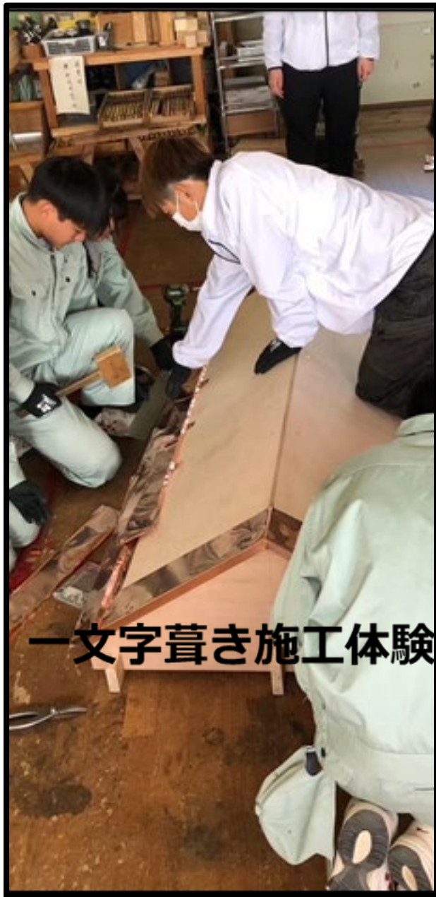
一文字葺き施工体験