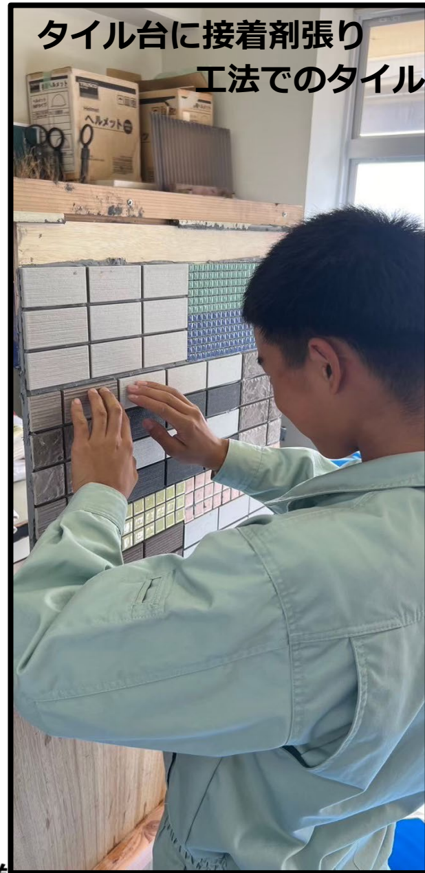
タイル台に接着剤張り 工法でのタイル